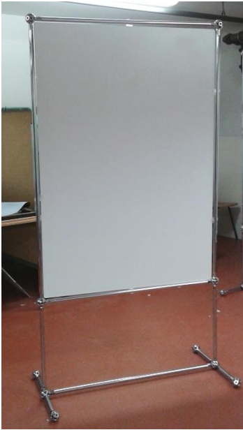
1 x 1 Meter max. 30 verfügbar je nach Auftragslage