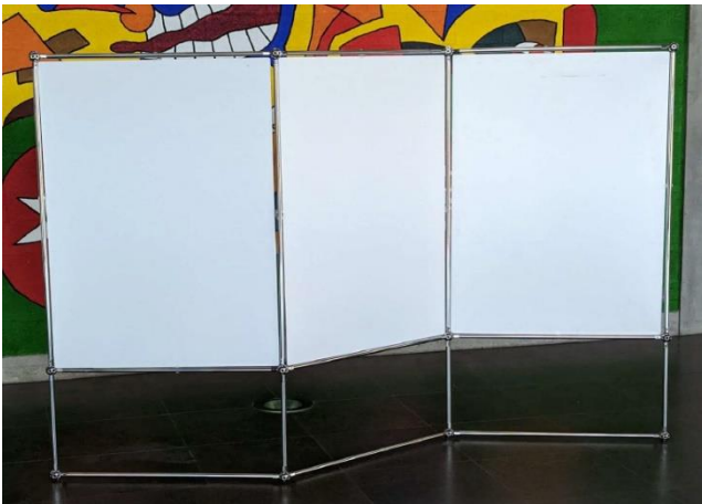
3 x 1 Meter max. 7 verfügbar je nach Auftragslage